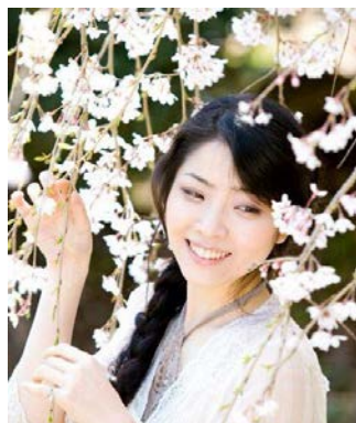
涼恵 -Suzue- Official Website http://suzue.asia/